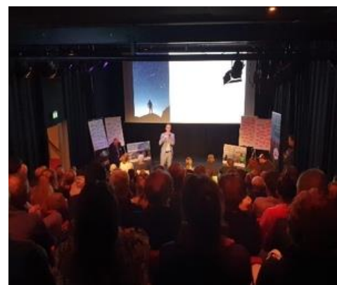
Fotocollage Camping Toekomst van Kampen